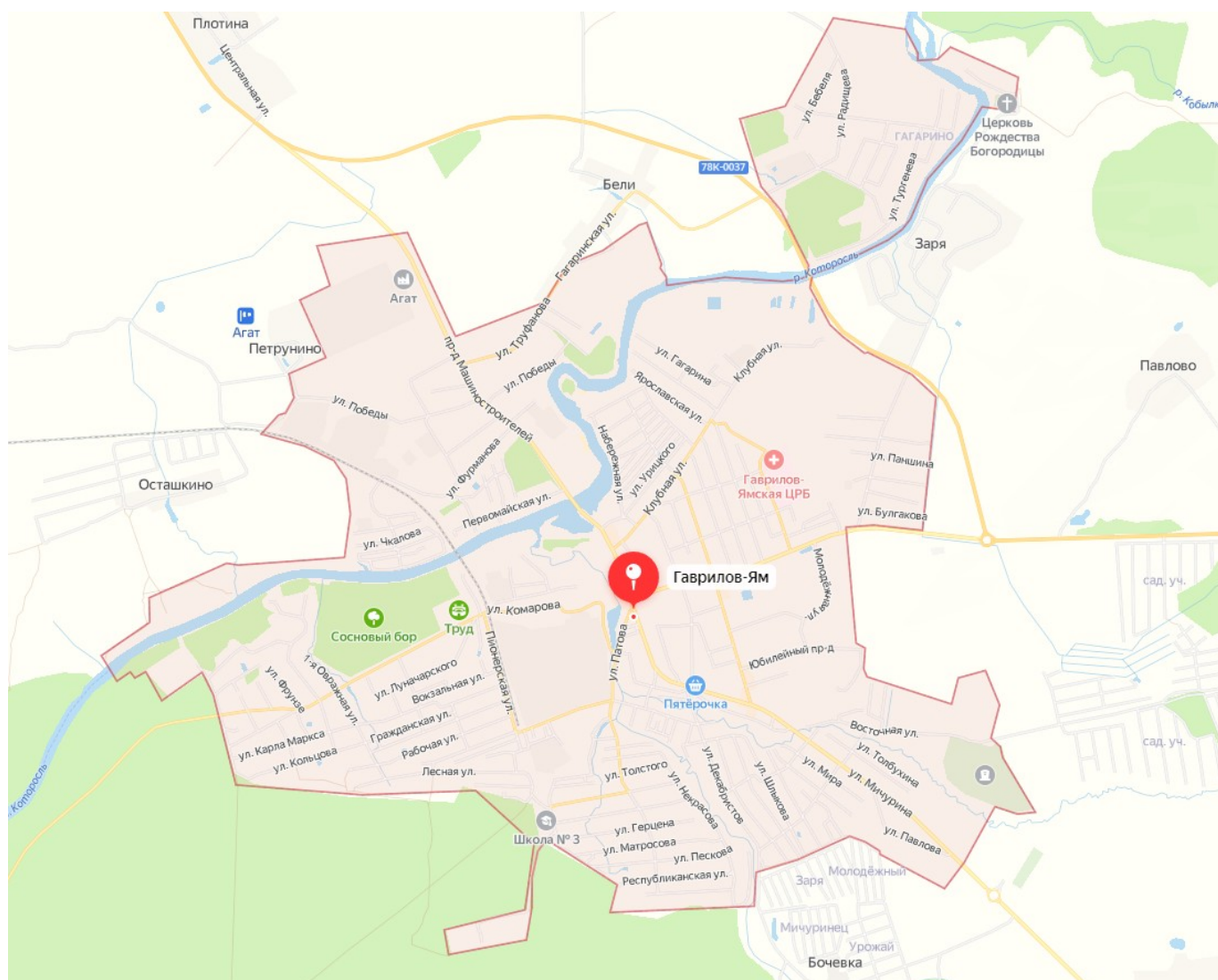
Рисунок 1 – Географическое расположение г. Гаврилов-Ям

Городское поселение Гаврилов-Ям граничит: на юге с землями государственного лесного фонда; на западе - с землями СПК «Колос»; на севере – с землями СПК «Родник»; на востоке- с землями Зайчье-Холмского сельского поселения.